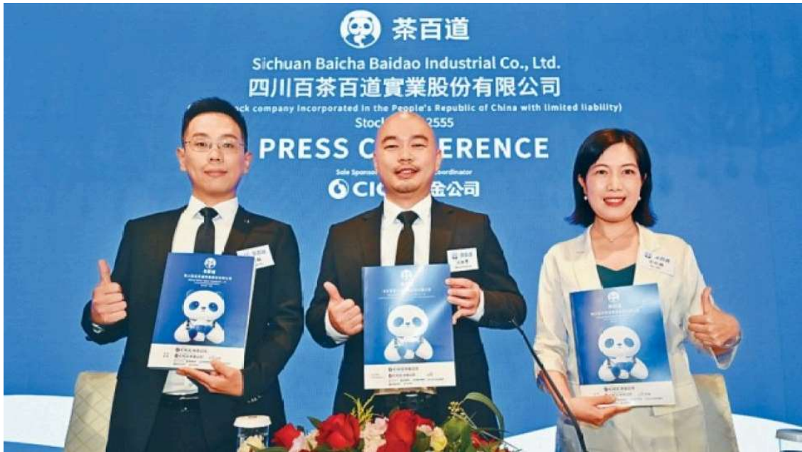
「茶百道」首日開盤即破發。